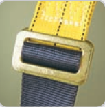
Boucle de sangles