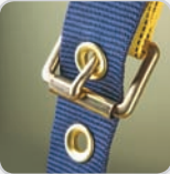
Boucle à ardillons